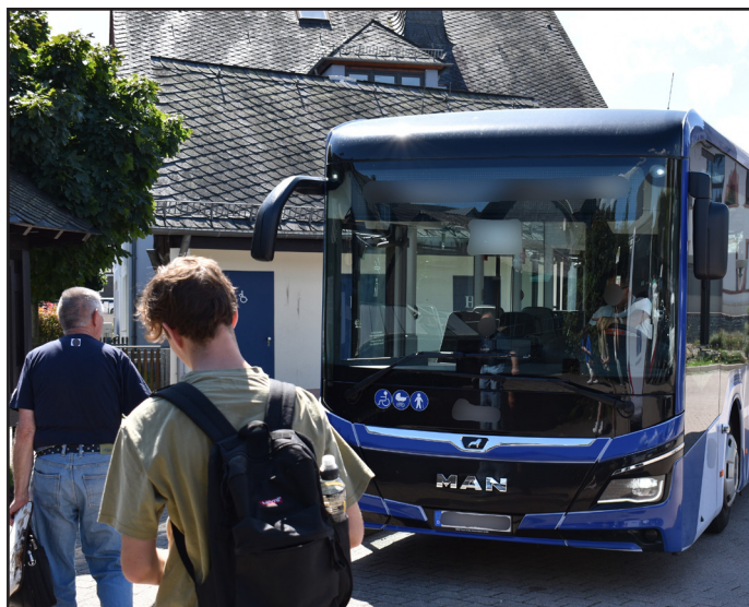
Auch der ZOB in Morbach wird ab 31. Juli 2024 zum Knotenpunkt für Umstiege auf die neuen blau-weißen VRT-Busse. Das Symbolbild zeigt einen Bus des Nachbarverbands RNN, der Morbach schon heute bedient.

Hier ein paar Beispiele für Verbindungen, die dank passenden Umsteigezeiten an Anschlusshaltestellen mög-