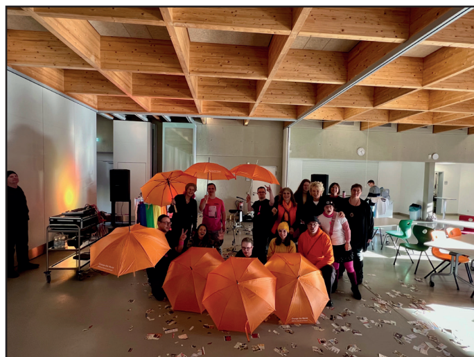
Auftakt Orange Days.