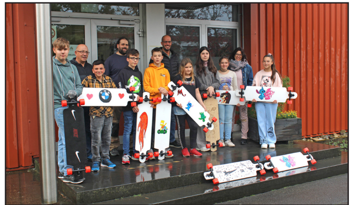
Stolz präsentieren die Teilnehmenden ihre neu geschaffenen Longboards.

In Kooperation mit dem rheinland-pfälzischen Ministerium für Wirtschaft, Verkehr, Landwirtschaft und Weinbau bot das ÜAZ-Wittlich in der ersten Woche der Herbstferien erneut das Mitmachprojekt „Senkrechtstarter“ zur außerschulischen Berufsorientierung an.