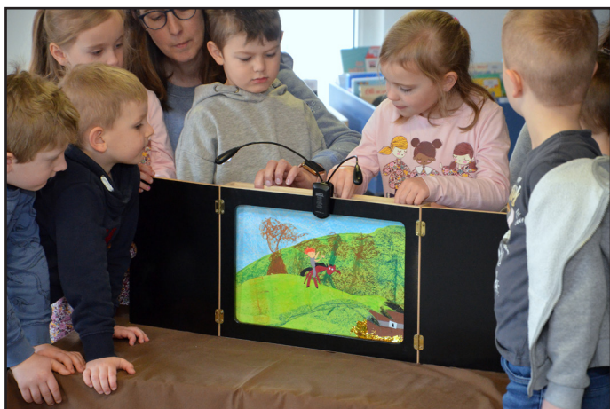
Meerfelder „Maarwichtel“: Bild für Bild mit dem selbstgestalteten Kamishibai durch die Drachen-Geschichte.