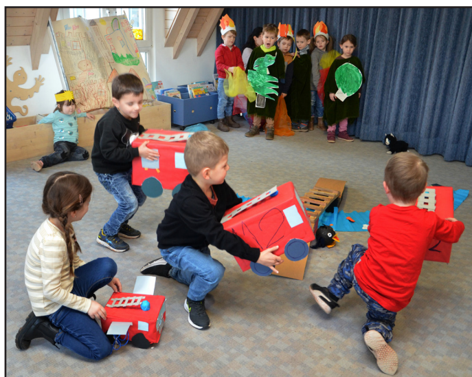
Mit Vollgas zum Einsatz: die Feuerwehrtruppe aus Bausendorf

durchlaufen sind. Am Schluss treffen sich alle beim großen Abschlussfest, wo das beliebteste Bilderbuch prämiert wird und die Kinder zur Belohnung ein professionelles Kindertheaterstück erleben dürfen. Für die nächste Runde im kommenden Herbst können noch zwei Anmeldungen entgegengenommen werden unter 06571 27036 oder anke.freudenreich@stadtbuecherei.wittlich.de.