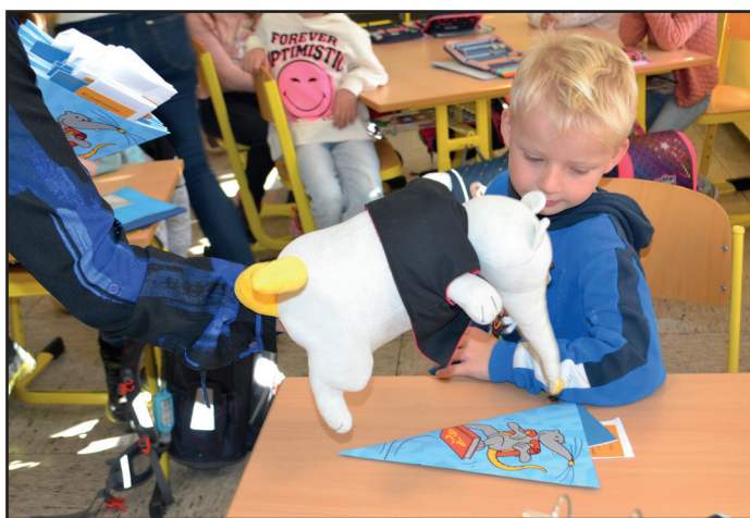
Überreicht von Leseratte Leslie höchstpersönlich: Schultüten in der Grundschule Großlittgen

tern darauf aufmerksam machen, dass die Bücherei ein wichtiger Bildungspartner und Begleiter in der Leseentwicklung ihrer Kinder ist und zahlreiche altersgerechte Medien bereithält. Die regelmäßige Bibliotheksnutzung und der Umgang mit Büchern soll schon von klein auf gefördert werden und zeigen wie wertvoll, spannend, lustig und informativ die Welt der Bücher sein kann.